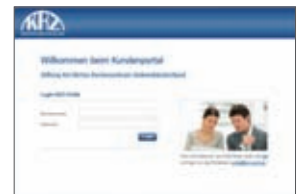
Die Login-Seite präsentiert sich in einem neuen Design.

Seit dem 19. August 2010 begrüßt Sie das KRZ-Portal in einem modernisierten Gewand. Wir haben den Kopfbereich und die Navigationsleiste von optischem Ballast befreit und in helle, freundliche Farben getaucht.