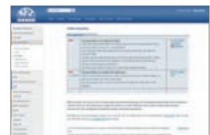
Die Gestaltung der inhaltlichen Seiten wurde ebenso modernisiert.

Die Neuerungen beziehen sich nur auf die optische Darstellung des Kopfbereiches (Logo, blauer Farbbalken) und des seitlichen Navigationsbereiches (Menüpunkte).