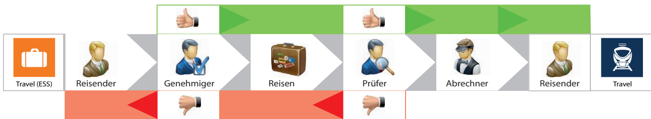
Grafik: Beispiel KIDICAP.Travel – Workflow mit SelfService

nung von Dienstreisen integriert und per E-Mail über jeden Status informiert oder beauftragt. Durch die im Produkt hinterlegten aktuellen Gesetzesregelungen und individuellen Reiserichtlinien sind alle Voraussetzungen für die rechtskonforme Abrechnung Ihrer Dienstreisen gegeben. Plausibilitätstests im Verfahren geben Ihnen zusätzliche Sicherheit.